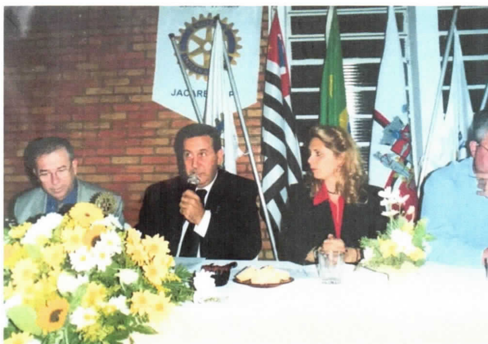
Presidente do Rotary Club Jacareí – Oeste (Ano Rotário 2001-2002)