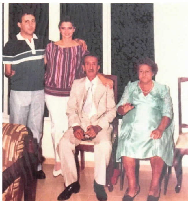
Em visitas aos seus pais...